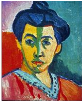
HENRI MATISSE - PESTRE BAREV