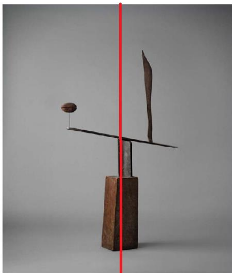
ASIMETRIČNA KOMPOZICIJA - dela na levi in desni polovici kipa si nista enaka