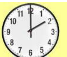
Ura je 2.00