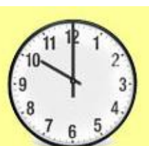
Ura je 10.00