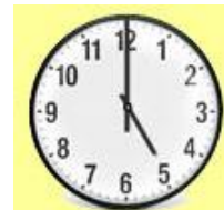
Ura je 5.00