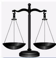
Tako tehtnico uporabljajo na tržnici.