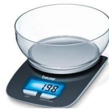
V gospodinjstvu uporabljamo digitalno tehtnico.