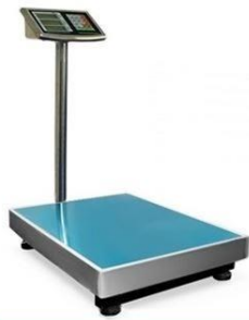
Tehnica za tehtanje mase ljudi.