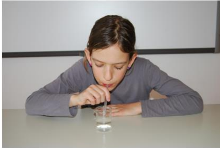
Bistra apnica na začetku pihanja.