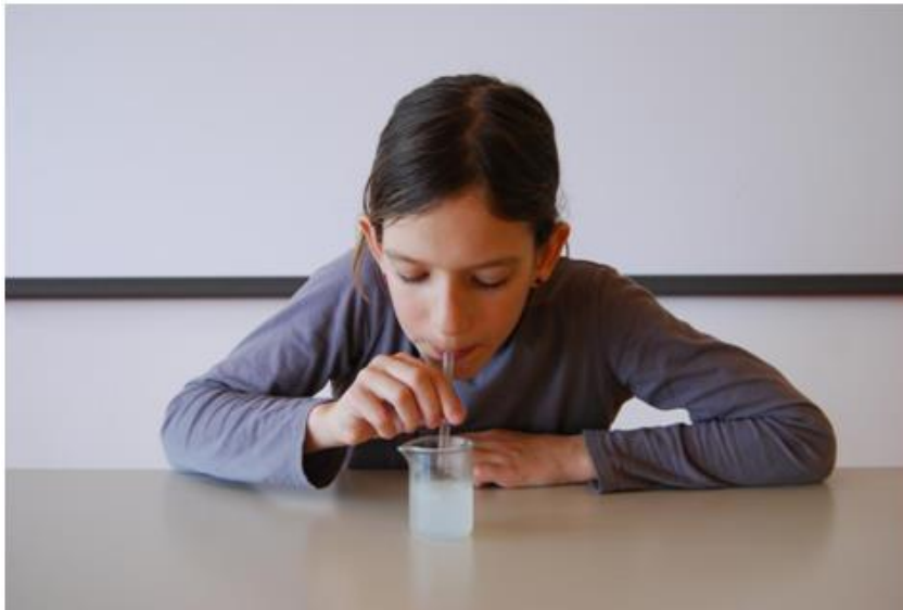
Motna apnica čez nekaj časa