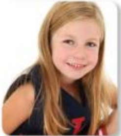
Jaz sem Evropejka.