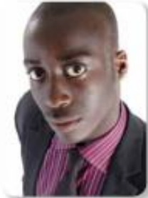
Jaz sem Afričan.