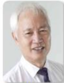
Jaz sem Kitajec.