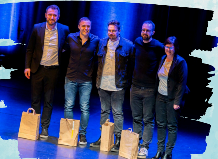
DOBRODELNI STAND UP V KULTURNEM CENTRU SEMIČ