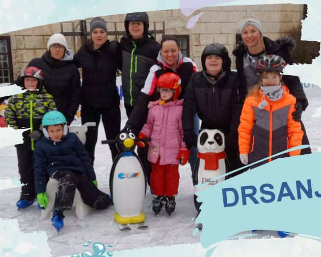
DRSANJE V METLIKI